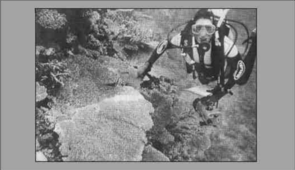
在这张2002年7月份的资料照片中，澳大利亚海洋科学研究所的研究人员在利泽德岛附近海底观察感染“白色综合症”的珊瑚。目前，澳大利亚大堡礁正面临着另一种新型的人类尚不了解的疾病威胁。

何标说，无论这件事是“台独”分子与“法轮功”邪教组织相互勾结的结果，还是“法轮功”邪教组织利用了台湾当局的支持、纵容，台湾当局现在都有责任、有义务站在正义的一边，立即采取措施予以查处，并杜绝类似事件再度发生。